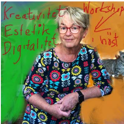
av Eva Tuvhav Gullberg